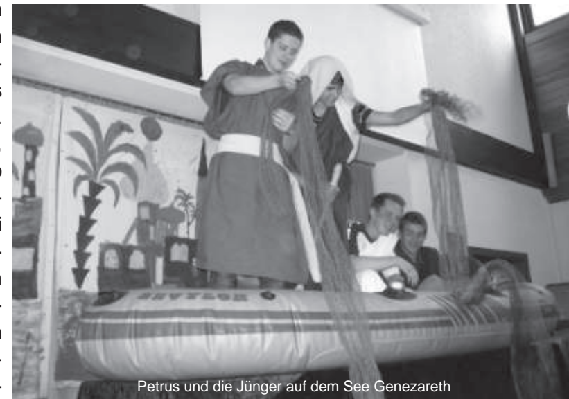
Petrus und die Jünger auf dem See Genezareth

aus dem Boot, um übers Wasser zu Jesus zu gehen. „Mensch, Petrus!“, so hieß es dieses Jahr bei der Kinderbibelwoche in den Osterferien. Jeden Morgen waren die Kinder wieder