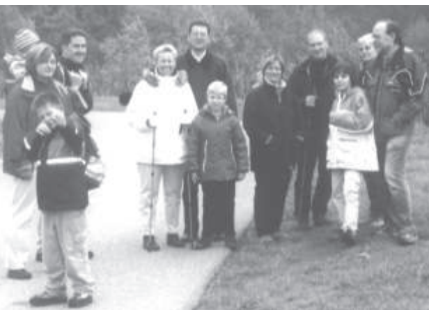
Herzliche Einladung zur diesjährigen Familienfreizeit der Stadtkirchengemeinde! Unser

Ziel liegt dieses Mal im Hohenlohischen. Die Pension Grafenhof bei Schwäbisch Hall bietet Familien, Paaren und Alleinstehenden die besten Möglichkeiten, sich zu entspannen und gut zu erholen. Schwäbisch Hall ist ein nahe gelegenes Ausflugsziel, die Umgebung ist bestens geeignet für Familienwanderungen und der Grillplatz lädt zu gemütlichen Abenden ein.