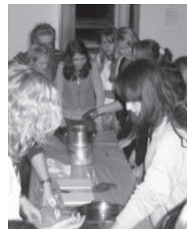
Hände werden in Wachs getaucht

Über 100 Jugendliche aus ganz Bietigheim sind zum Start des neuen Jugendtreffs gekommen. Die „Fackelträger“ sorgen zu Beginn für Stimmung, und dann nehmen die Jugendlichen das gesamte Gemeindehaus in Beschlag: Im Foyer tauchen Todesmutige ihre Hände in flüssiges Wachs, im Untergeschoss startet das Tischkicker-Blitzturnier. Vor der Theke warten Hungerige auf ihren Hot Dog, andere machen es sich in der Sofa-Lounge ge-