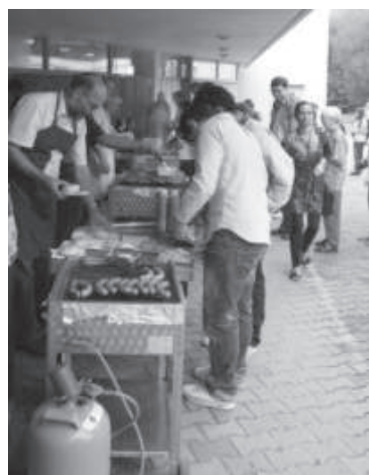
Leckerles vom Grill beim Gemeindefest

Beim Gemeindefest mit Alphornbläsern aus der Schweiz und einer Tombola, ließen wir uns durch das Wetter nicht aus