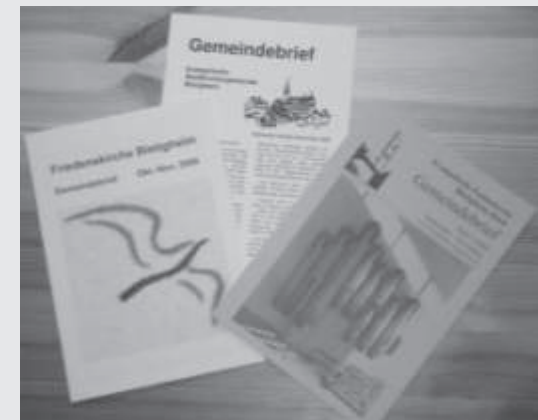
Die letzten Gemeindebriefe der drei Teilgemeinden

Heute halten Sie das erste Heft des gemeinsamen Gemeindebriefes in Händen. Wir freuen uns