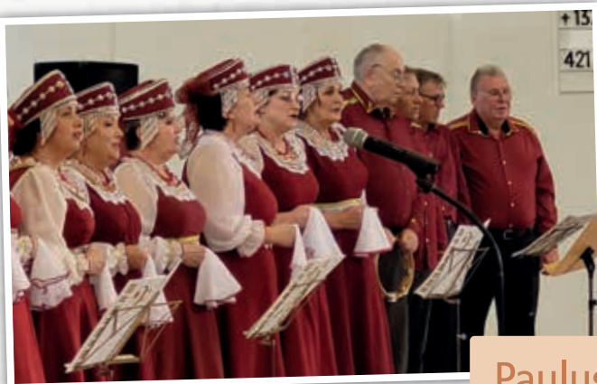
In der vollbesetzten Pauluskirche gaben der Chor Garmonia und die Tanzgruppe Mariella ein Stelldichein mit ernsten und fröhlichen Liedern und anmutig heiteren Tänzen.