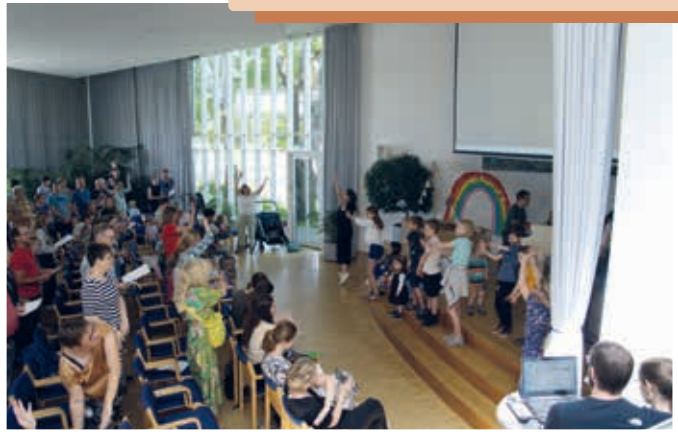
Kirche Kunterbunt am 9. Juni im Enzpvavillon.