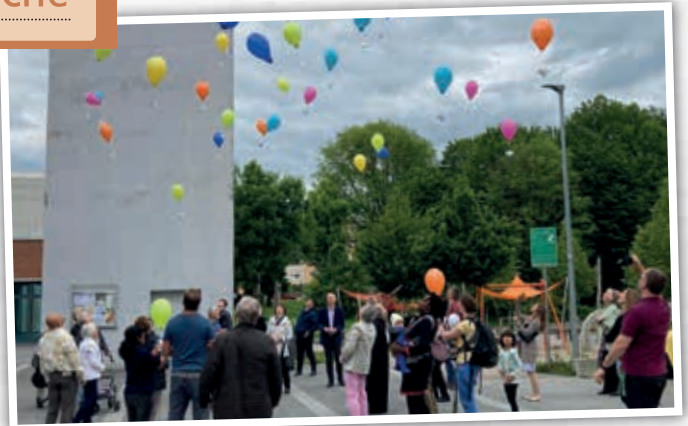
Familiengottesdienst an Pfingsten – Mit viel Freude und großem Jubel flogen die Geburtstagswünsche für die Kirche nach dem Familiengottesdienst in der Pauluskirche in die Lüfte empor.