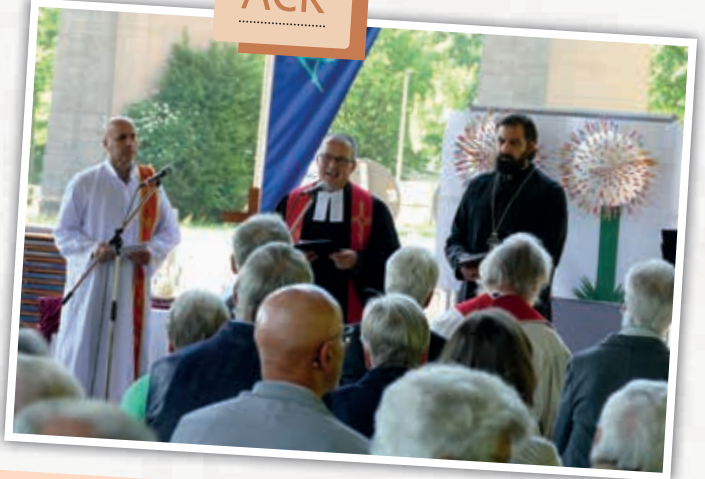
Wunderbarer ACK Gottesdienst am Dreschschuppen mit Beteiligung aller Kirchen. Musikalisch begleitet von der Chor der Syrisch orthodoxen Kirche und die Brass Company Bietigheim den Gottesdienst. Als Symbol für Pfingsten diente eine selbst gebastelte Pustblume mit Schirmchen. Die Gottesdienstgemeinde beteiligte sich engagiert bei der Frage, welche verschiedenen Wirkungen des Geistes wir brauchen – Geist des Friedens, Geist der Hoffnung ...